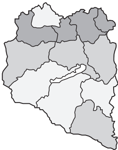
1. ábra: A legalább négy középiskolai osztályt végzettek aránya a Dunántúlon, 1910

A négyosztályos középiskolai végzettségűek adata regionálisan is értelmes mintázatot mutat eltérően a nyolc középiskolai osztályos iskolai végzettségtől. Jól látható például (1. ábra) a dunántúli kultúrlejtő: a Budapestet Béccsel összekötő megyékben 3,5–4 százalék között van a férfi lakosságban a legalább négy középiskolát végzettek aránya, az észak–déli tengelyen nézve középső megyékben 3 és 3,5 százalék között, míg délen 3 százalék alatt. (Pécs külön számításával Baranya is a 3 százalék alatti sávban marad.) 14